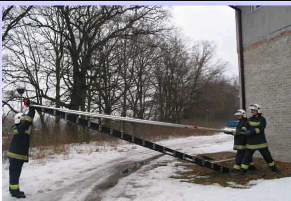
Podnoszenie drabiny do pozycji pionowej.