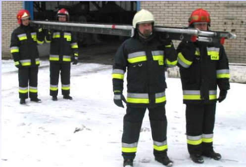
Transport drabiny na miejsce akcji