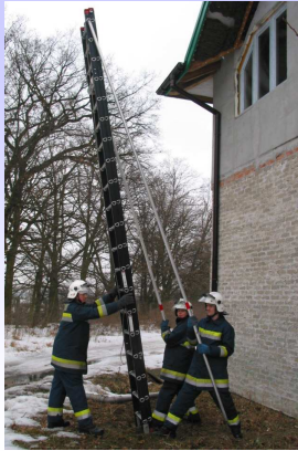
Pozycja przed oparciem drabiny o ścianę