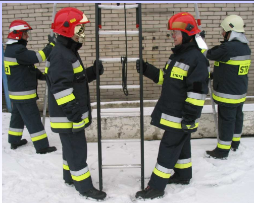
Asekuracja pracujących na drabinie.